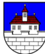
Ústí nad Orlicí

Hlavní poskytovatelé finančních prostředků na zajištění činnosti CEDR Pardubice o.p.s.