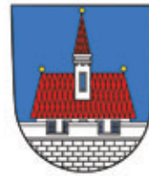
město Ústí nad Orlicí